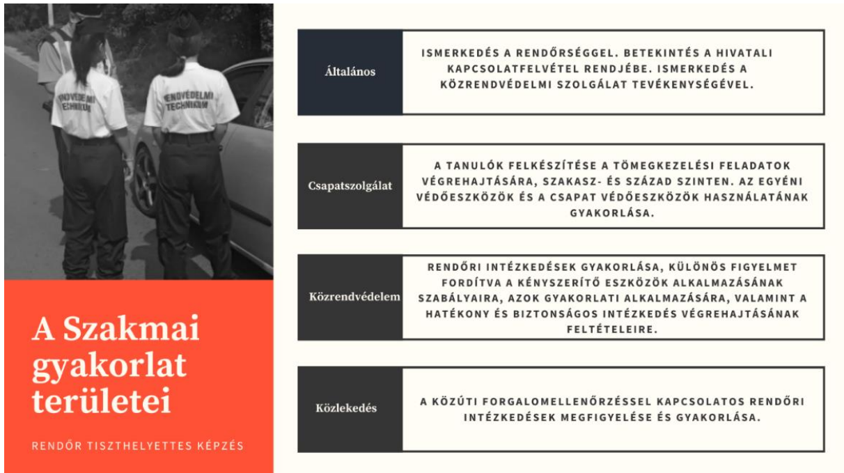
1. számú kép: A Szakmai gyakorlat területei

Az egy-, másfél és kétéves képzésben részt vevő tanulók szakmai gyakorlatukat annál a rendvédelmi szervnél teljesítik, amelyet az Országos Rendőrfőkapitány jelöl ki az Éves Gyakorló Szolgálat Tervben. Amíg a képzés befejezése utáni kinevező területi rendőri szerv nem meghatározott, addig a tanulók lehetőség szerint a lakhelyük szerinti rendőri szervnél teljesítik gyakorlati képzésüket.