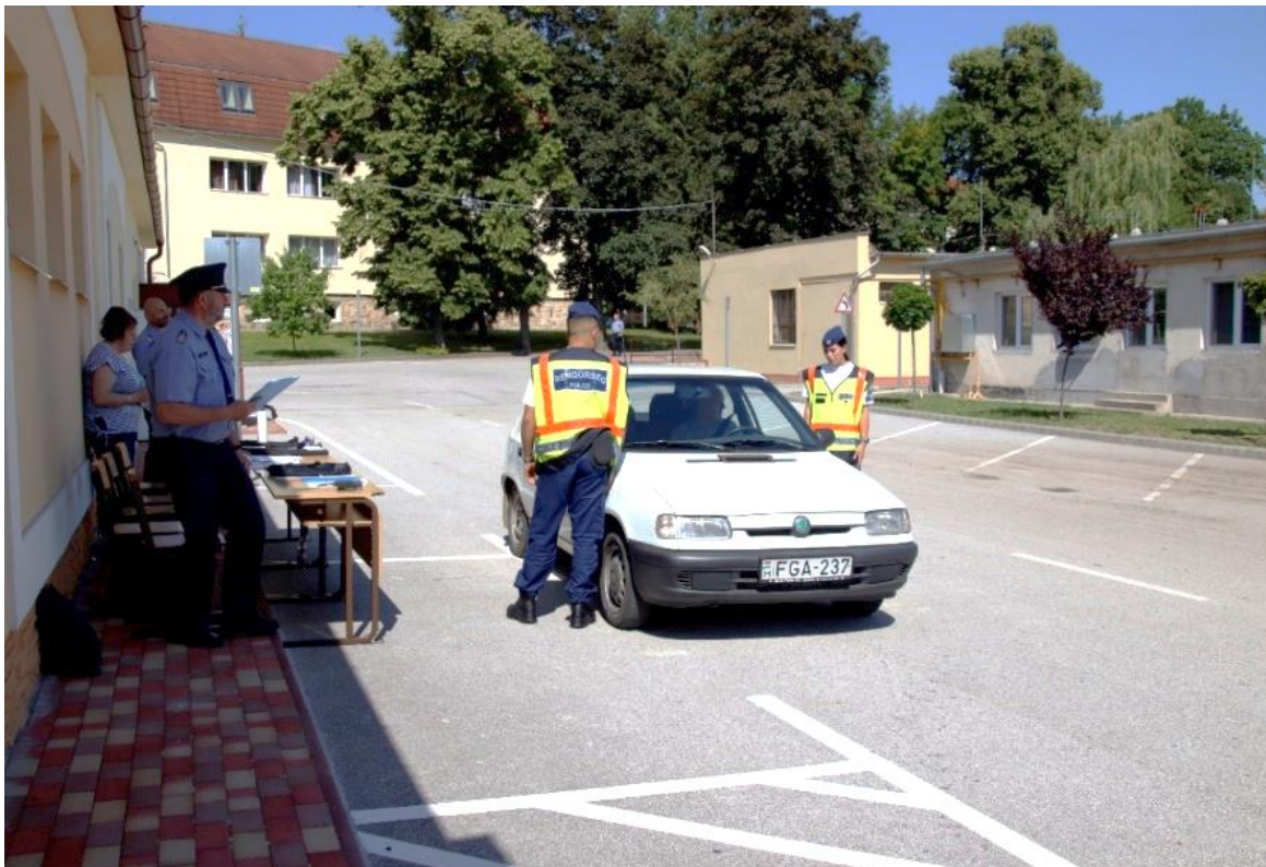
3. számú kép: Szintvizsga szituáció

A feladatok végrehajtása során az alábbi tantárgyak ismeretanyagára támaszkodva kell a szituációs feladatokat végrehajtani: Társadalmi és kommunikációs ismeretek, Rendőrségi digitális alkalmazások, Szakmai idegen nyelv, Rendőri testnevelés, Közrendvédelem, Rendőri intézkedések, Közlekedési ismeretek, Határrendészeti ismeretek, Bűnügyi ismeretek.