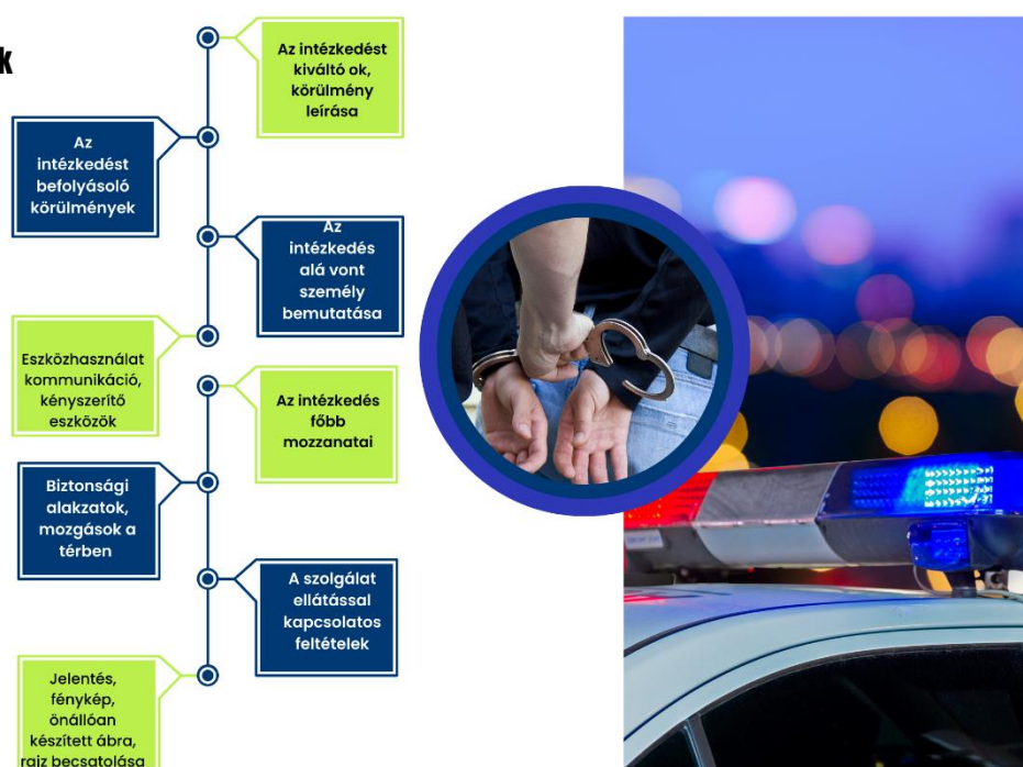
6. számú ábra: Intézkedés felépítése